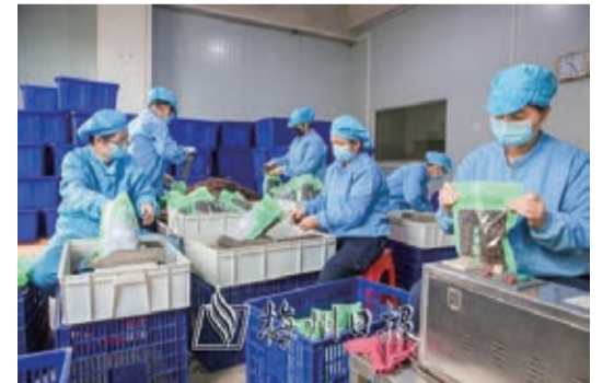
廣東深華中藥飲片有限公司生產車間一景。