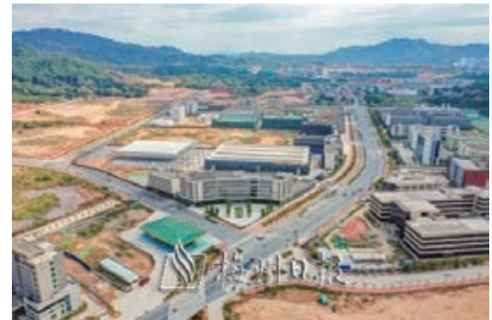
豐順縣堅持製造業當家，發展壯大實體經濟，推動蘇區高質量振興發展。