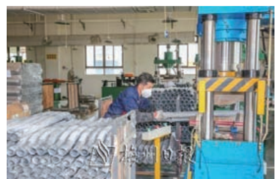
梅州市銘海車業有限公司“上規”後，今年的訂單量同比去年增長30%以上。