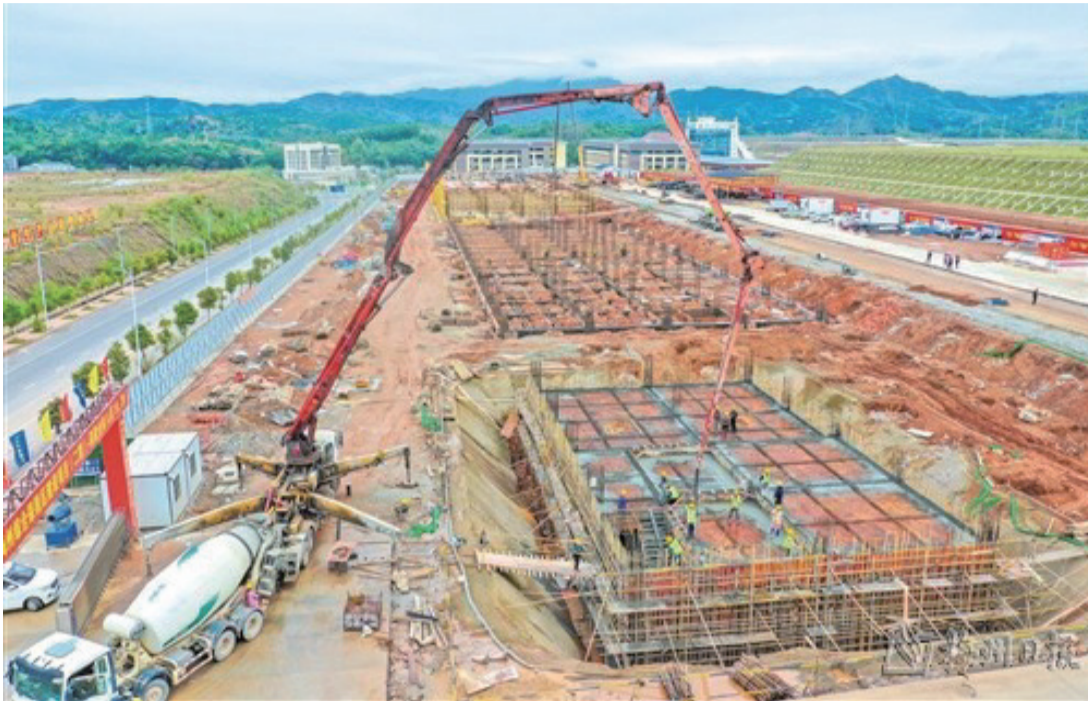
梅州綜保區保稅倉庫項目建設現場一派火熱施工景象。