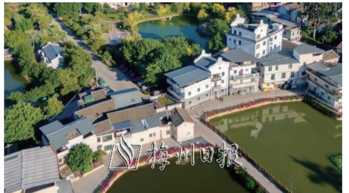
梅江區西郊街道黃泥墩社區通過創建綠色社區，讓社區環境更美麗、居民生活更舒心。

社區是居民生活和城市治理的基本單元，是聯繫、服務居民的“最後一公里”。在創建綠色社區期間，我市結合城鎮老舊小區改造、居住社區建設補短板行動、人居環境整治、全國文明城市創建等工作，把创建工作引向深入，使社區環境更加美麗的同時，還加強貫穿人文關懷、適老化改造等，